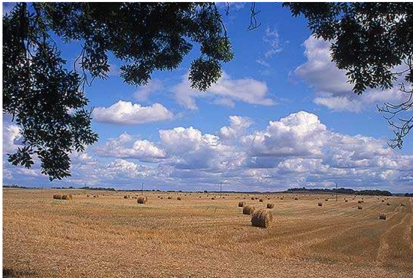
Landwirtschaft in der Uckermark