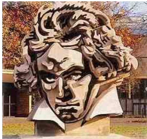
Beethoven Grundschule Bonn

Die Stiftung fördert das Projekt „Kinder stark machen“ an der Beethoven Grundschule in Bonn über die Beratungsstelle gegen sexualisierte Gewalt. Ziel des Präventionsprojektes gegen sexuellen Missbrauchs ist es, Jungen und Mädchen zu stärken und ihnen damit zu ermöglichen, ihr Recht auf Selbstbestimmung wahrzunehmen. Das Projekt ist ganzheitlich angelegt und bindet die erwachsenen Bezugspersonen mit ein. Das Konzept enthält daher auch eine Lehrer/Innen Fortbildung und einen Informationsabend für Eltern.