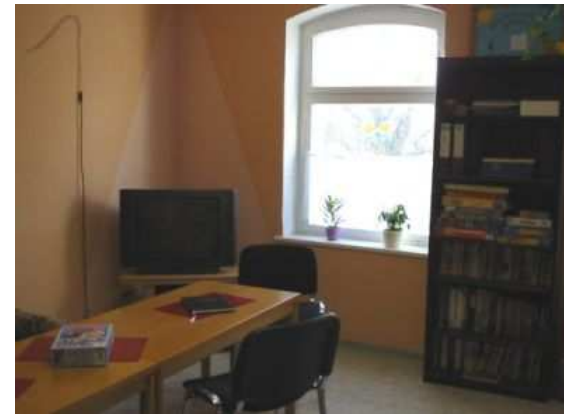
Ev. Kinder- und Jugendhaus Klockow

Mit einem Zuschuss der Stiftung konnte der Ev. Pfarrsprengel Schönfeld / Kr. Uckermark eine Mitarbeiterstelle im Bereich der Kinder- und Jugendarbeit realisieren. Diese strukturschwache, von Landwirtschaft geprägte Region leidet unter einer starken Abwanderung, die Arbeitslosenquote liegt bei 30%. Die Mitarbeiterin, eine sozialpädagogisch ausgebildete Fachkraft, konnte in den 14 zu betreuenden Dörfern ca. 20 Kinder- und Jugendgruppen aufbauen, wobei das Ev. Kinder- und Jugendhaus Klockow als Zentrum genutzt wird. Hier finden zahlreiche Veranstaltungen, wie z.B. Kinderfeste und Wochenendcamps statt, die vor allem von sozialschwachen Familien genutzt werden.